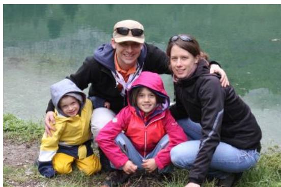
Der Pastor und seine Familie